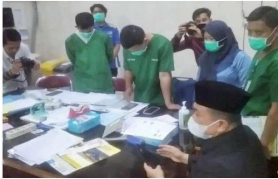
EVALUASI : Gubernur Jambi Al Haris saat Sidak ke RSUD Raden Matallah Jambi beberapa waktu lalu. Gubernur akan mengevaluasi kinerja manajemen rumah sakit pelat merah tersebut.

Seperti diketahui, insiden sengketa ini sempat viral dibarengi dengan pelayanan RSUD Raden Matallah Jambi. Sebelumnya pada Agustus 2023 lalu Al Haris juga sempat marah besar dengan pihak rumah sakit pelat merah itu yang menolak pasien berobat karena tidak memiliki BPJS Kesehatan dan Surat Keterangan Tidak Mampu (SKTM) hingga akhirnya pasien tersebut meninggal dunia di rumahnya. baca Gubernur hal 2